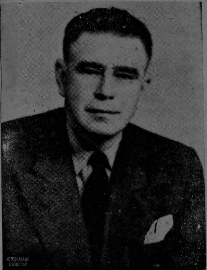
DON OTILIO ULATE BLANCO Jefe de la Oposición Victoriosa en los comicios celebrados el 8 de Febrero de 1948

Pongamos todos nuestra fe de costarricenses en estos dos hombres que son cimiento de un futuro prometedor para Costa Rica. Pongamos la fe que sintieron nuestros gloriosos caídos, cuando ofrendaron sus vidas por la libertad, la decencia y la justicia